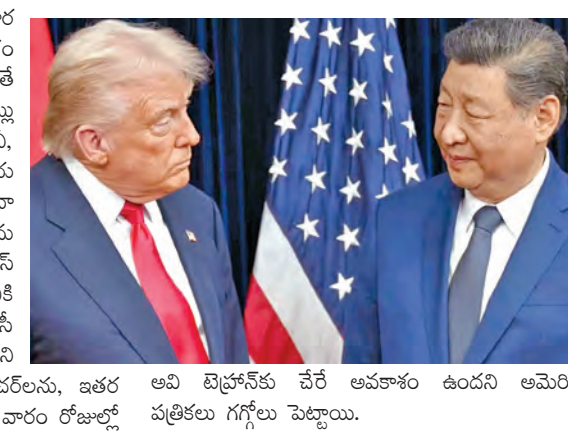
అమెరికా అధ్యక్షుడు డోనాల్డ్ ట్రంప్ (ఎడమ) చైనా అధ్యక్షుడు షి జిన్ పింగ్ (కుడి) తో కలిసి ఉన్నారని తెలుస్తోంది.

మీడియా సంస్థలు తమపై నిరాధార ఆరోపణలతో కథనాలు ప్రసారం చేస్తున్నాయని విమ ర్శించింది. అయితే చైనా నుంచి ఆయు ధాలు అందినట్లు ఇరాన్ బహిష్కరించగా వెల్లడించింది. కానీ, తాము అమెరికా విమానాలను విజయవంతంగా కూల్చి దానికీ చైనా ఆయుధాలను వాడలేదని, తమ ఆధునాతన రక్షణ వ్యవస్థలే యూఎస్ విమానాలను కూల్చానని ఉపయోగపడ్డాయని ఐఆర్జీసీ వెల్లడించింది. భుజం మీద పెట్టుకొని ప్రయోగించే షార్ట్ రేంజ్ మిసైల్ లాంచర్లను, ఇతర ఆవి బెట్రోన్లను చేరే అవకాశం ఉందని అమెరికా ఓపిఎస్ వ్యవస్థలను సరఫరాచేస్తున్నదని, వారం రోజుల్లో వర్తమాలు గగ్గలు పెట్టాయి.