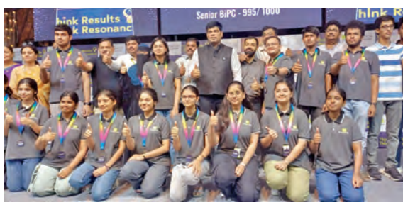
హైదరాబాద్, ఏప్రిల్ 12, ప్రభాతవార్త: ఇంటర్ ఫలితాలలో రెసిడెన్షియల్ ప్రభం