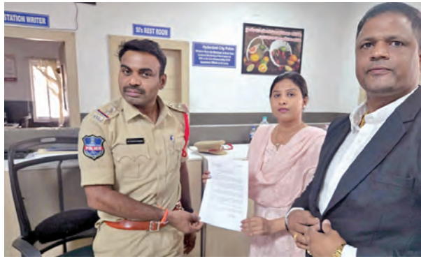
పంజాగుట్ట పోలీసుస్టేషన్లో ఎన్ఫోర్స్ ఫిర్యాదు కాపీని అందజేస్తున్న సింగర్ మంగ్లే